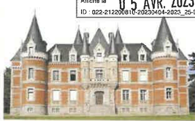
Le château des Aubiers