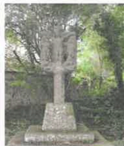
La croix de Bonabry