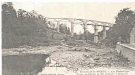
Le viaduc des Ponts-Neufs